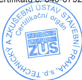
Razítko certifikačního orgánu

Tato příloha je nedílnou součástí certifikátu č. 040-079249.